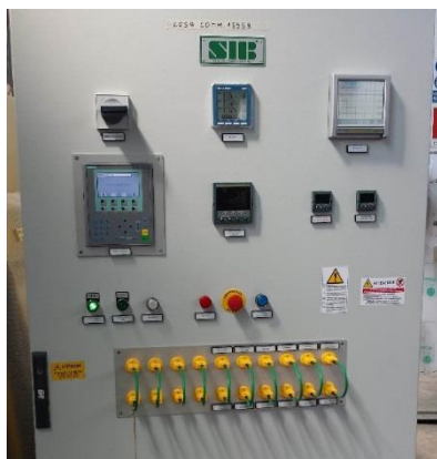
Dettaglio cabina elettrica e videate pannello touch screen