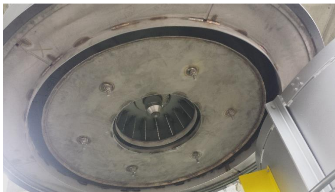
Interno forno con camicia di ricircolo e resistori Fibrothal, coperchio con motore-ventola e deflettore

Per ulteriori dettagli, come pure per ricevere un'offerta o la visita di un ns incaricato, vogliate contattare il ns Ufficio Commerciale